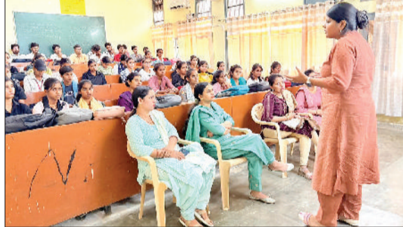
महम। सेमिनार को संबोधित करते हुए ऑर्गेन इंडिया की प्रोजेक्ट एक्सप्लैट दिया गुसेम।

डॉसी ने किसानों से अपील की कि वे जैजिक उपाय अपनाकर भूमि की सेहत सुधारें। उन्होंने केंचुआ खाद, गोबर खाद और हरी खाद के उपयोग पर बल देते हुए कहा कि इससे मिट्टी में पोषक तत्वों की पूर्ति होगी और उत्पादन में वृद्धि होगी। बैठक में बताया गया कि जिले के आसन, रिठाल फौगाट, किलोई खास और किलोई दोपाणा गांवों में सब-सर्पेस ड्रेनेज का कार्य शुरू कर दिया गया है, जिससे सेम (जलमाराव) की समस्या का समाधान किया जाएगा। वहीं कलानीर कलां और माडोधी जाटान-राजधान क्षेत्र की लवणीय भूमि के सुधार के लिए करीब साढ़े चार करोड़ की परियोजना पर काम चल रहा है। इस परियोजना के तहत वटिकल ड्रेनेज सिस्टम स्थापित किया जाएगा। दोनों क्षेत्रों की करीब 3000 एकड़ भूमि इस योजना से लाभान्वित होगी। गेहूं कटाई के बाद यहां 20-20 सेंटीमीटर आधरित ड्रेनेज ट्यूबवेल भी लगाए जाएंगे।