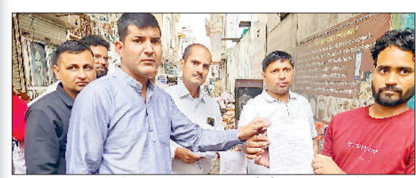
रोहतक। दुकानदारों को चालान देते नगर निगम की टीम।