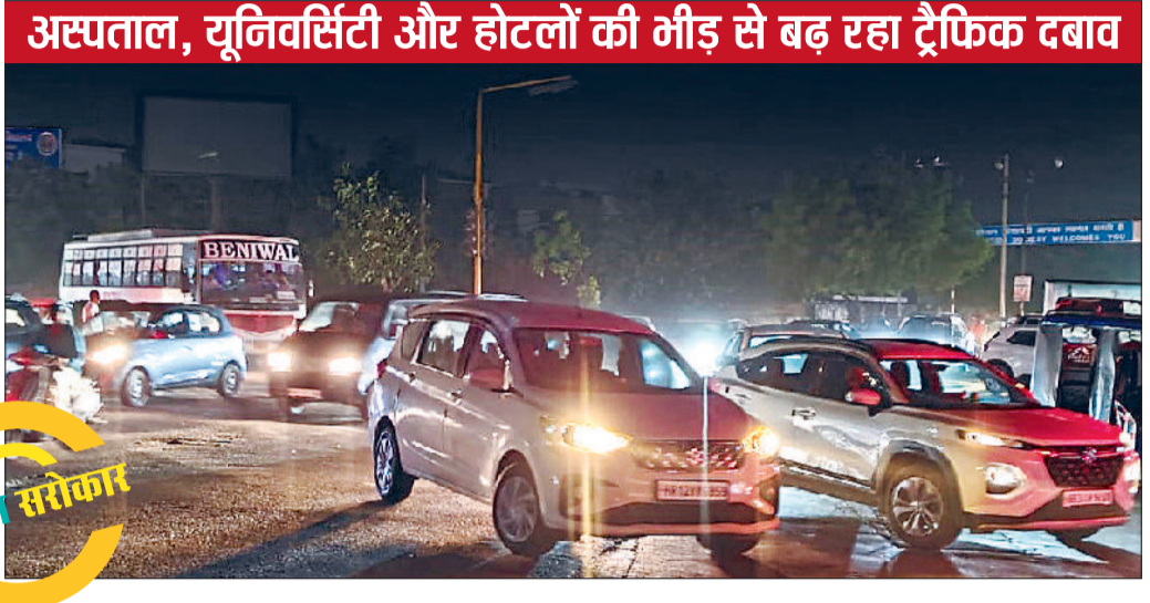
अस्पताल, यूनिवर्सिटी और होटलों की भीड़ से बढ़ रहा ट्रैफिक दबाव

दिल्ली बाइपास इन दिनों शहर की लाइफलाइन कम और जाम का सबसे बड़ा हॉटस्पॉट बनता जा रहा है। अस्पताल, यूनिवर्सिटी, सर्किट हाउस, आईजी ऑफिस और होटलों जैसे प्रमुख केंद्रों के बीच स्थित यह मार्ग दिनभर भारी ट्रैफिक दबाव झेल रहा है। सुबह और शाम के पीक आवस में तो हालात और बिगड़ जाते हैं, जब कुछ ही दूरी तय करने में लोगों को 20-30 मिनट तक का समय लग जाता है।